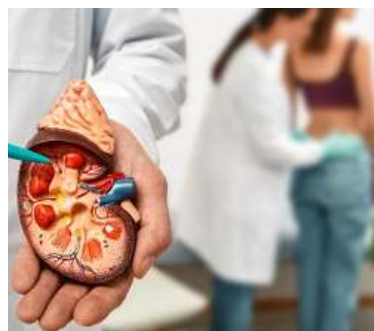
Los riñones en Ayurveda