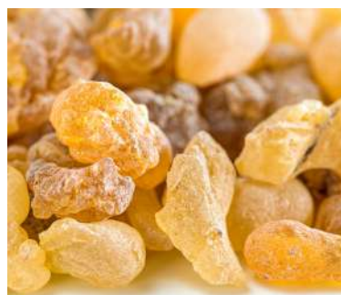
Beneficios de la Boswellia Serrata