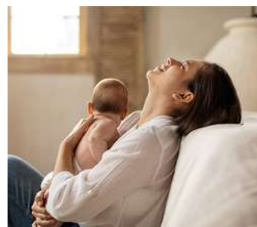
Puerperio en Ayurveda