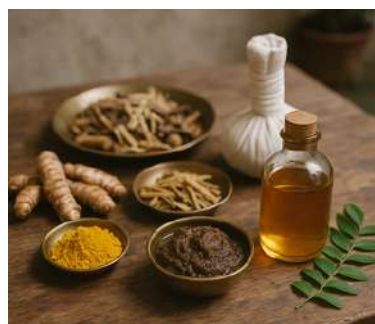
¿Qué es Rasayana en Ayurveda?