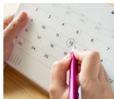
Programación ESAY 2026