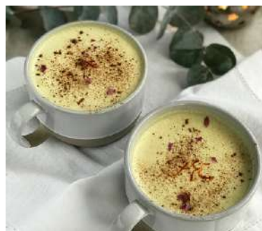
Ksheerapaka en Ayurveda