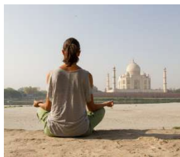
Preguntas frecuentes: Diploma Intensivo India