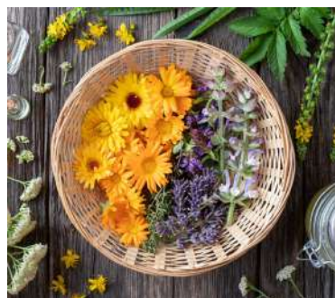
Recolección de plantas medicinales en Ayurveda