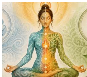
Las seis etapas de la enfermedad en Ayurveda