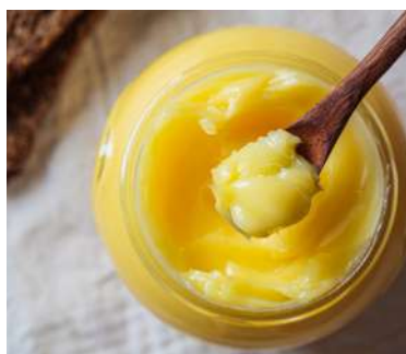
Beneficios del ghee para los niños