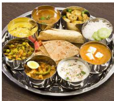
8 claves de una dieta sana en Ayurveda