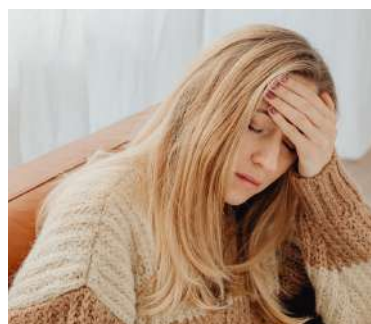
Cansancio en Ayurveda