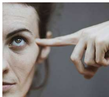
La personalidad del paciente en Ayurveda